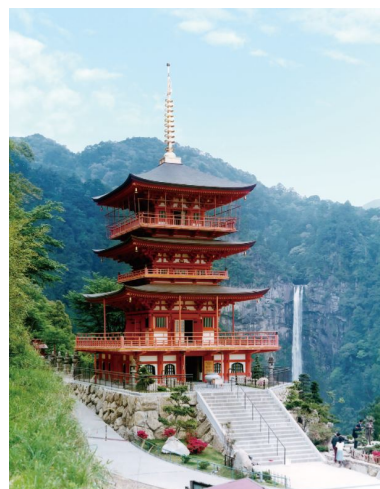
那智山青岸渡寺三重塔