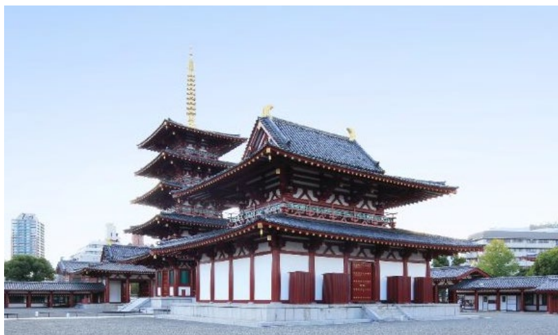
和宗総本山 四天王寺 金堂